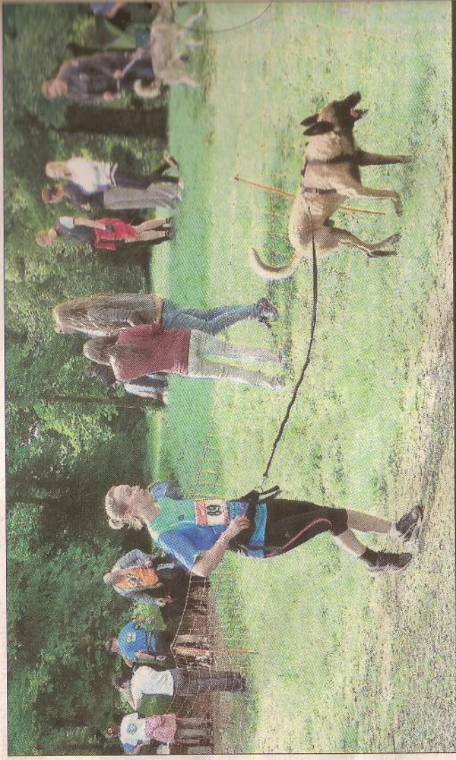
SPORT. Le canicross est un sport d'équipe entre le maître et le chien.